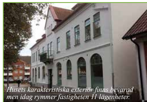
Husets karakteristiska exteriör finns bevarad men idag rymmer fastigheten 11 lägenheter.

Det är drygt 100 år sedan huset byggdes och många verksamheter, förutom Apoteket, har huserat