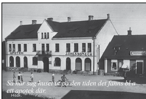
Så här såg huset ut på den tiden det fanns bl a ett apotek där. Höör.

Även om det är länge sedan det fanns ett apotek där så kallas fastigheten vid Lilla Torg fortfarande för Apotekshuset i folkmun.